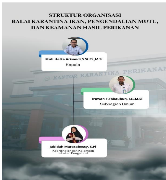
Gambar 1. Struktur Organisasi Balai KIPM Ambon

Struktur organisasi Balai KIPM Ambon sebagaimana tertuang dalam Peraturan Menteri Kelautan dan Perikanan Nomor: 92/PERMEN-KP/2020. Struktur organisasi Balai KIPM Ambon dapat dilihat pada gambar 1.